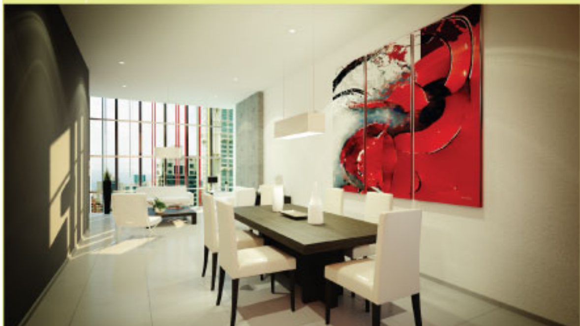
Sede de Grupo Inmobiliario Ferrocarril, S.A. en España