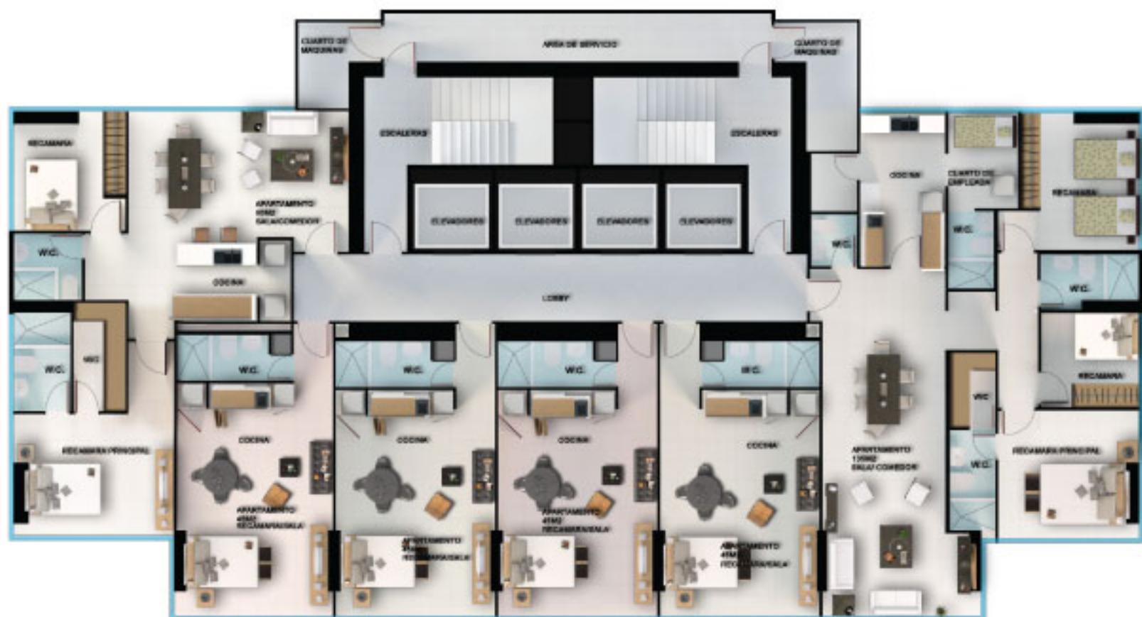
PLANTA DE ESTUDIOS OPCIONES DE 45M2, 90M2 Y 135M2