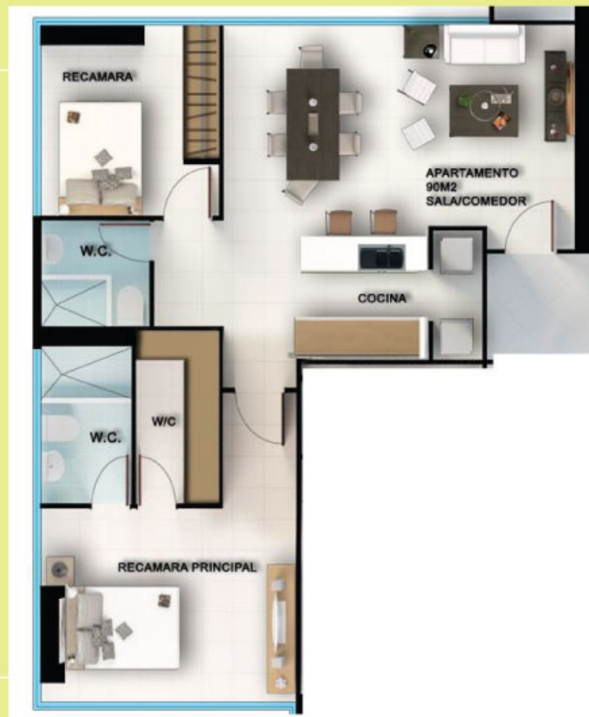
PLANTA DE ESTUDIO DE 90M 2 CON 2 ESTACIONAMIENTOS.