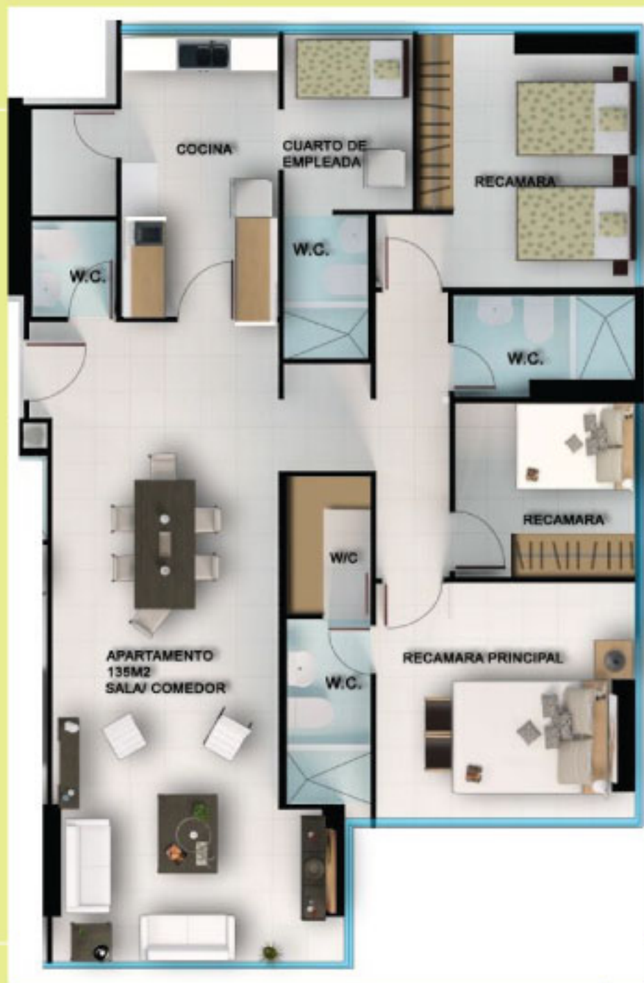
PLANTA DE ESTUDIO DE 135M 2 CON 3 ESTACIONAMIENTOS.